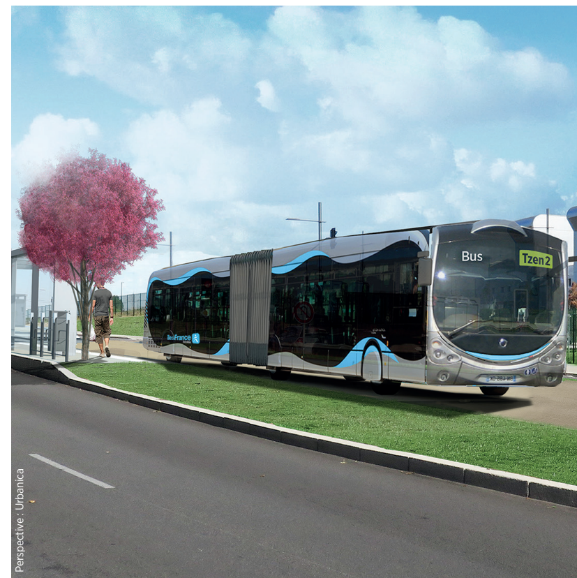
Perspective : Urbanica

Conception graphique : Île-de-France Mobilités - Rédaction et réalisation graphique : Département de Seine-et-Marne - Octobre 2019