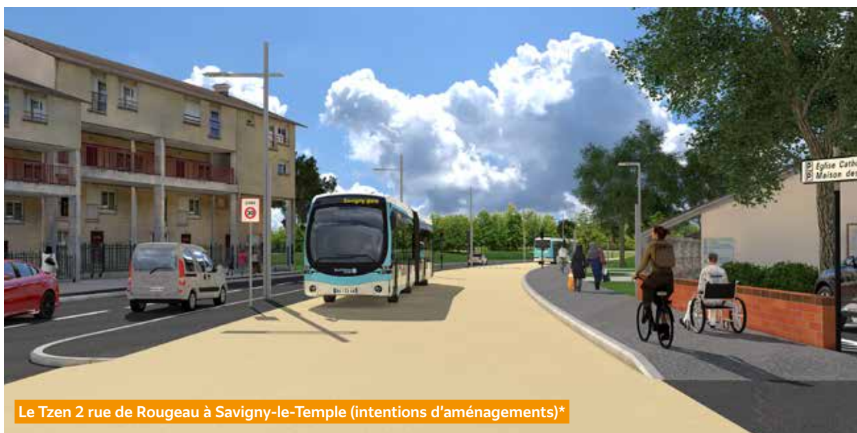
Le Tzen 2 rue de Rougeau à Savigny-le-Temple (intentions d'aménagements)*

A terme, la nouvelle ligne de bus Tzen 2 offrira une meilleure desserte de vos quartiers en proposant un nouveau moyen de transport régulier, confortable et moderne.