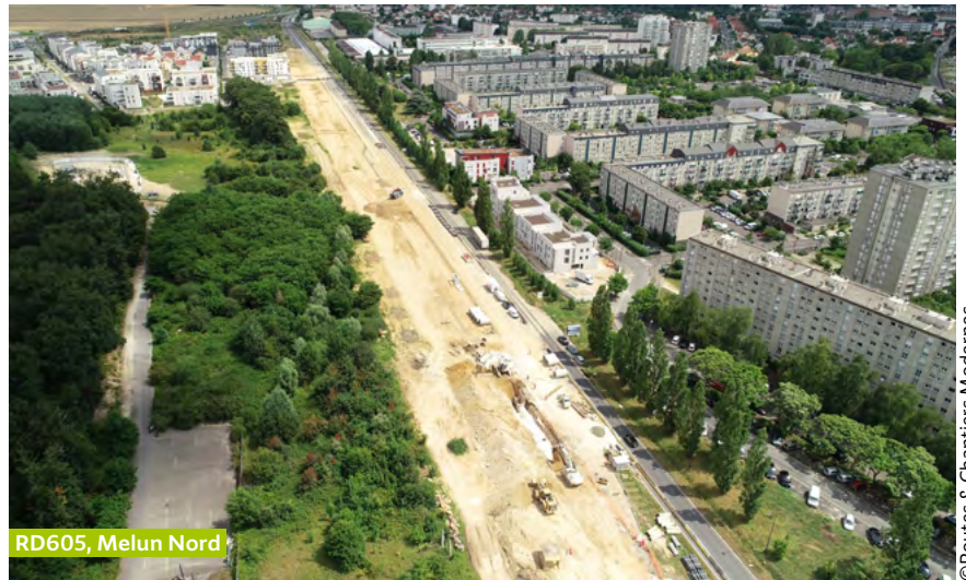
RD605, Melun Nord