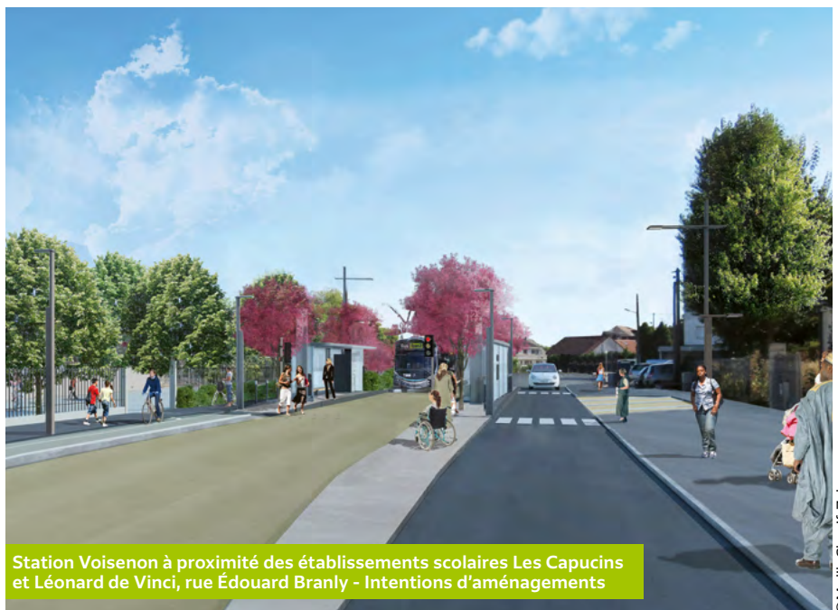
Station Voisenon à proximité des établissements scolaires Les Capucins et Léonard de Vinci, rue Édouard Branly - Intentions d'aménagements

Objectifs : intégrer la voie dédiée au Tzen 2 et une station (Voisenon*) afin de desservir les établissements scolaires et de nombreuses habitations, mais aussi de requalifier les trottoirs et espaces publics.