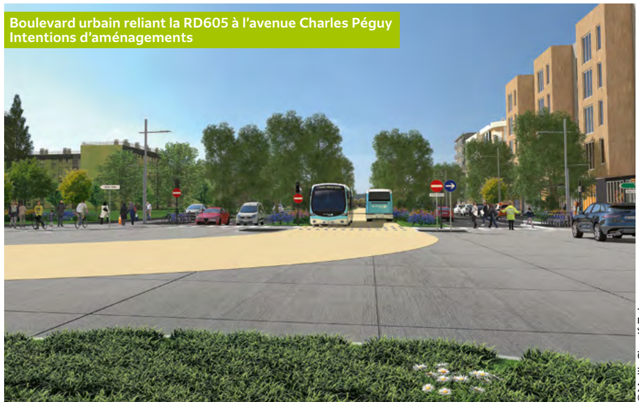
Boulevard urbain reliant la RD605 à l'avenue Charles Péguy Intentions d'aménagements

Objectifs : requalifier cette route départementale en boulevard urbain, offrir un cadre plus agréable (plantations, circulation apaisée, aménagements piétons et cycles, etc.), relier la route départementale à la rue Charles Péguy et créer un second accès au nouveau quartier Woodi, intégrer la voie dédiée au Tzen 2 et une station (Montaigu*) afin de relier plus rapidement le Nord de la commune au centre-ville et à la gare.